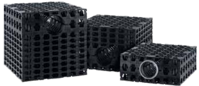
Standaard afmetingen en volumes

Verdere functiekenmerken zijn: verbindingmogelijkheden zowel horizontaal als verticaal, extreme belastbaarheid, een grote opslagcapaciteit van 95%, driedimensionaal waterdoorlatend, met aan alle kanten aansluit- en verbindingmogelijkheden, van DN 160. Daarnaast is het IT Plus® Variobox SP systeem 100% compatibel met de IT Plus® Controlbox en biedt legio varianten, vooral voor onderhoud en inspectie.