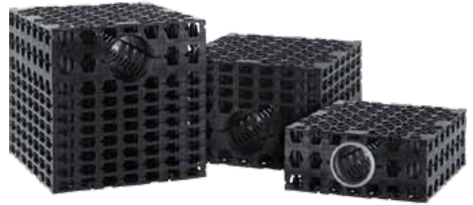
Standaard afmetingen en volumes

Verdere functiekenmerken zijn: verbindingsmogelijkheden zowel horizontaal als verticaal, extreme belastbaarheid op zeer lage inbouwhoogte, een grote opslagcapaciteit van 95%, driedimensionaal waterdoorlatend, met aan alle kanten aansluit- en verbindingsmogelijkheden, van DN 160. Daarnaast is het IT Plus® Variobox systeem 100% compatibel met de IT Plus® Controlbox en biedt legio varianten, vooral voor onderhoud en inspectie.